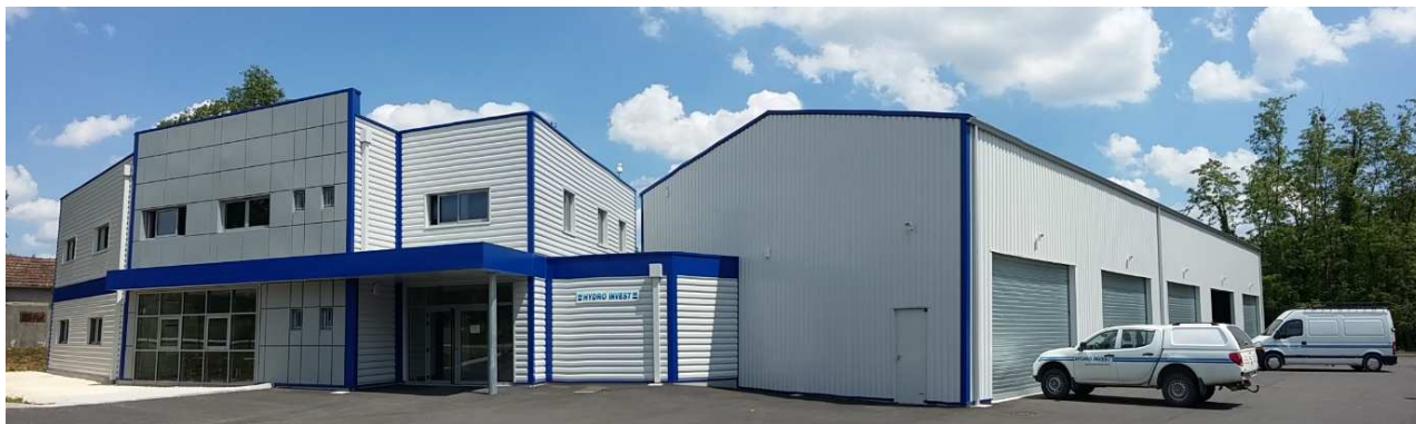
Nos locaux climatisés par un doublet géothermique